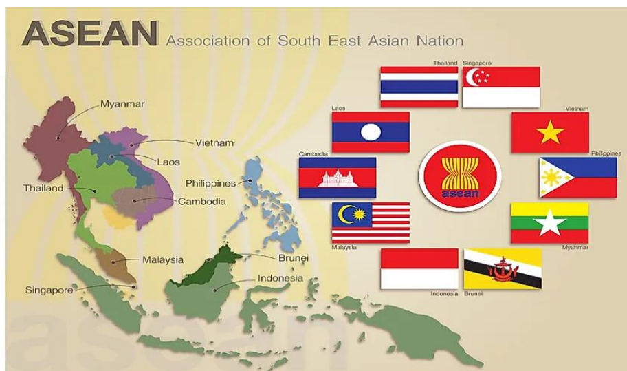
Fig.1. Asian countries in the World state map. Adapted from reference [2].

АСЕАН-ны гишүүн орнуудын нийт газар нутаг 4.4 сая ам дөрвөлжин км. Мөн гишүүн орнуудын нийт хүн ам нь 625 орчим /2016 оны байдлаар/ сая хүн буюу дэлхийн нийт хүн амын 8,8% эзэлж байна.