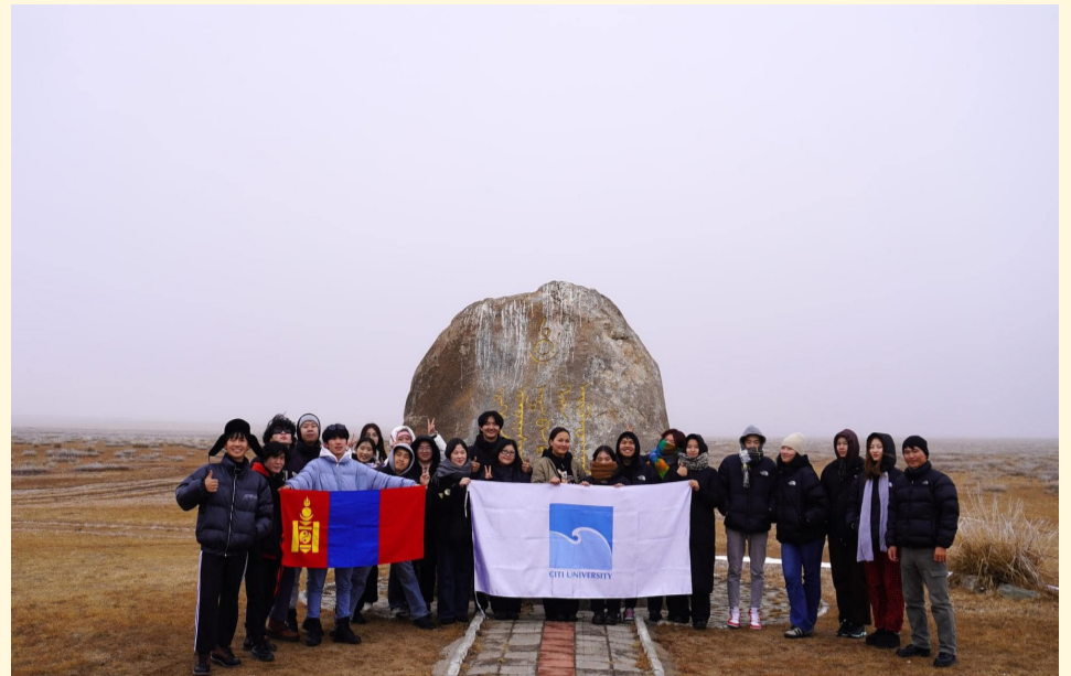
Аялал жуулчлалын тэнхимийн дэргэдэх “Urban Adventure” клуб 2024-2025 оны хичээлийн жилийн анхны аяллаа Сэлэнгэ аймгаас эхлүүлээ.

Шаалуу хүү “МАУГЛИ” пластик жүжгийг толилуулах гэж байна. Та бүхнийг урьж байна.