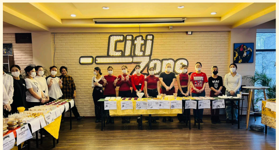
“СИТИ” Их сургуулийн Гоо сайхны ухааны сургуулийн оюутнуудын жил бүр уламжлал болгон зохион байгуулдаг “ГОО САЙХАН-ЭРҮҮЛ ХООЛ 2024” өдөрлөг амжилттай болж өнгөрлөө.